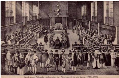
Nationale Synode gehouden te Dordrecht in de jaren 1618-1619

Nu worden synodes wel meer gehouden. Niet altijd vallen daar bijzondere dingen van te vertellen. Maar deze synode was er één die we ons mogen blijven herinneren. We hebben er namelijk één van de zes belijdenisgeschriften aan te danken, de Dordtse Leerregels. Maar dat is niet het enige belangrijke werk van die synode geweest. De kerkorde werd er vastgesteld. En er werd opdracht gegeven om aan een goede Nederlandse vertaling van de bijbel te werken. Die is er ook gekomen. Die vertaling kennen we vandaag als de Staten Vertaling. Redenen genoeg, om ons met deze heel bijzondere vergadering uit de kerkgeschiedenis bezig te houden!